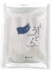
(株)グラスキューブ