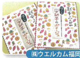
(株)ウエルカム福岡