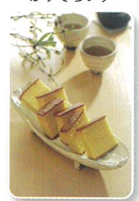
(株)セイアグリーシステム