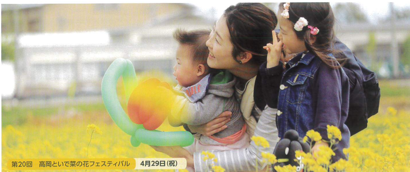
第20回 高岡といで菜の花フェスティバル 4月29日(祝)

令和2年3月25日 発行 発行：高岡市商工会 広報委員会 〒939-1104 富山県高岡市戸出町3丁目8番10号 TEL.0766-63-6585 FAX.0766-63-6586