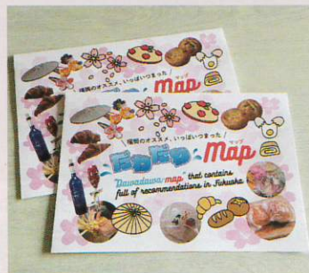
地元店舗や観光モデルコースなどを掲載した“だわだわMap”