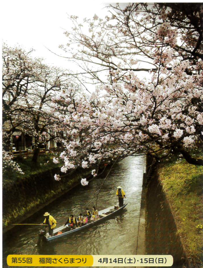
第55回 福岡さくらまつり 4月14日(土)・15日(日)