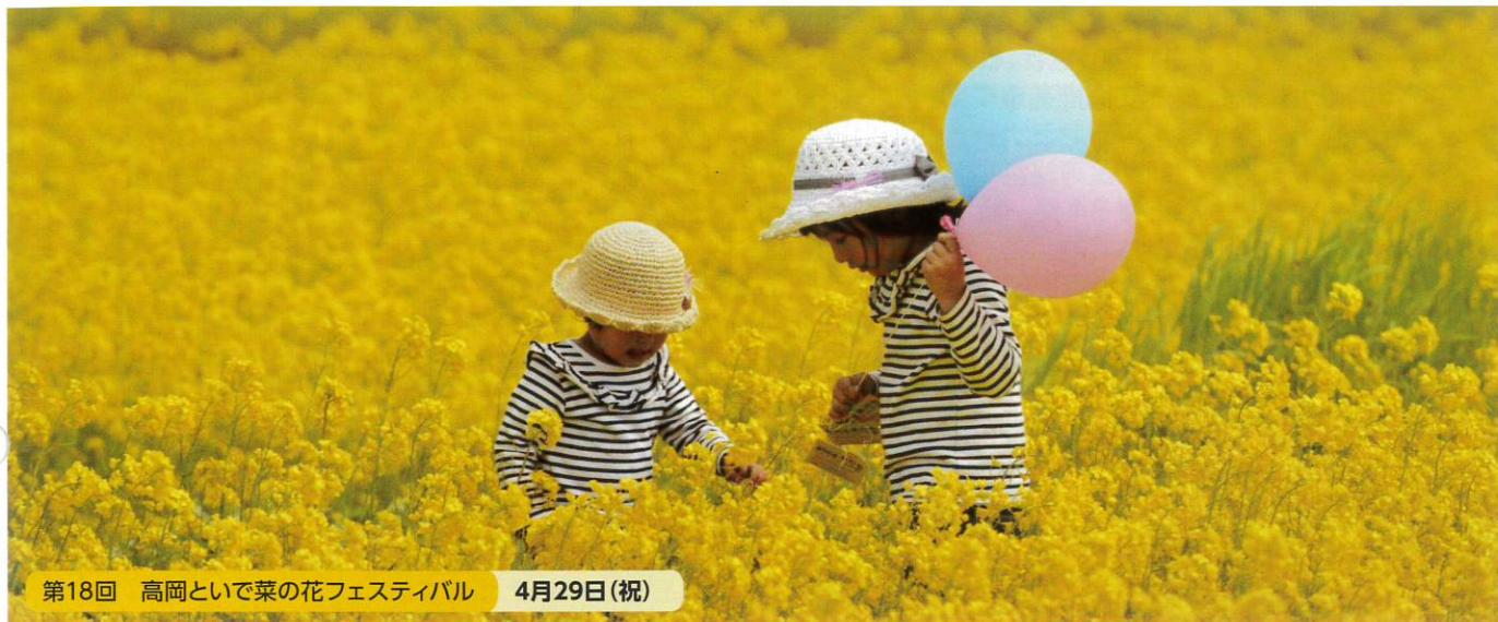
第18回 高岡といで菜の花フェスティバル 4月29日(祝)

平成30年3月23日 発行 発行：高岡市商工会 広報委員会 〒939-1104 富山県高岡市戸出町3丁目8番10号 TEL.0766-63-6585 FAX.0766-63-6586