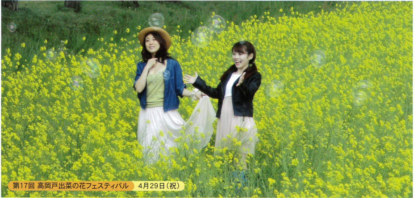
第17回 高岡戸出菜の花フェスティバル 4月29日(祝)

平成29年3月24日 発行 発行: 高岡市商工会 広報委員会 〒939-1104 富山県高岡市戸出町3丁目8番10号 TEL.0766-63-6585 FAX.0766-63-6586