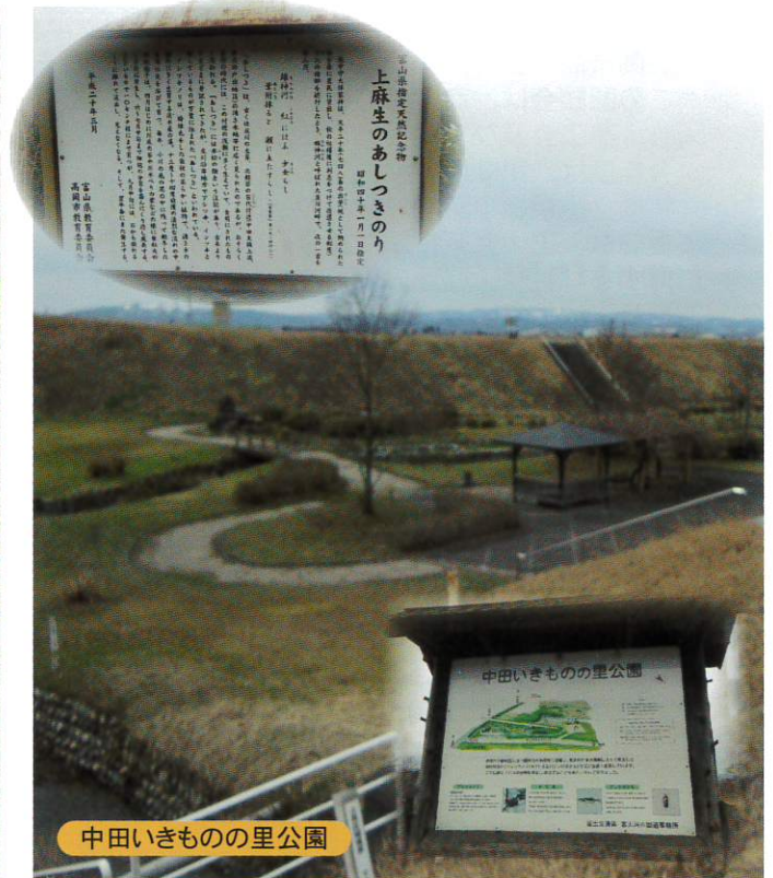
中田いきもの里公園