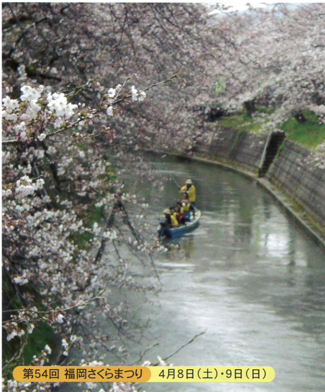
第54回 福岡さくらまつり 4月8日(土)・9日(日)