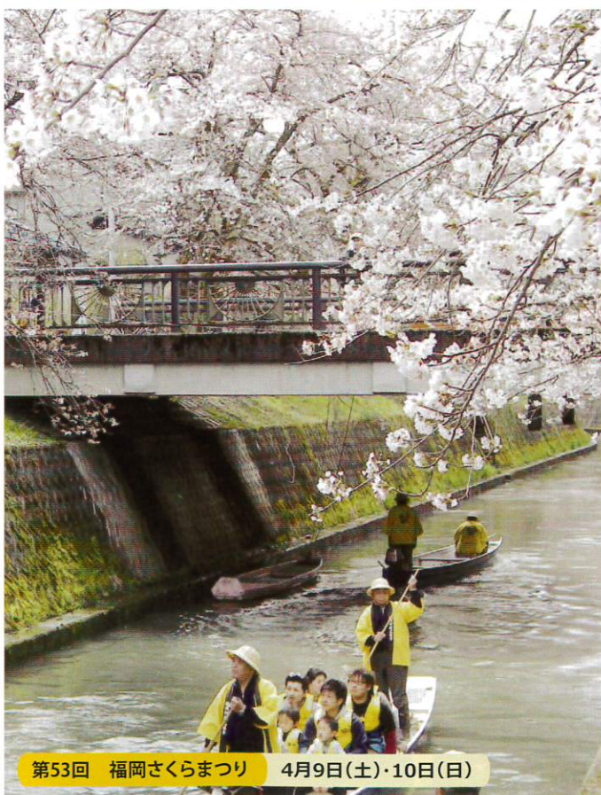
第53回 福岡さくらまつり 4月9日(土)・10日(日)