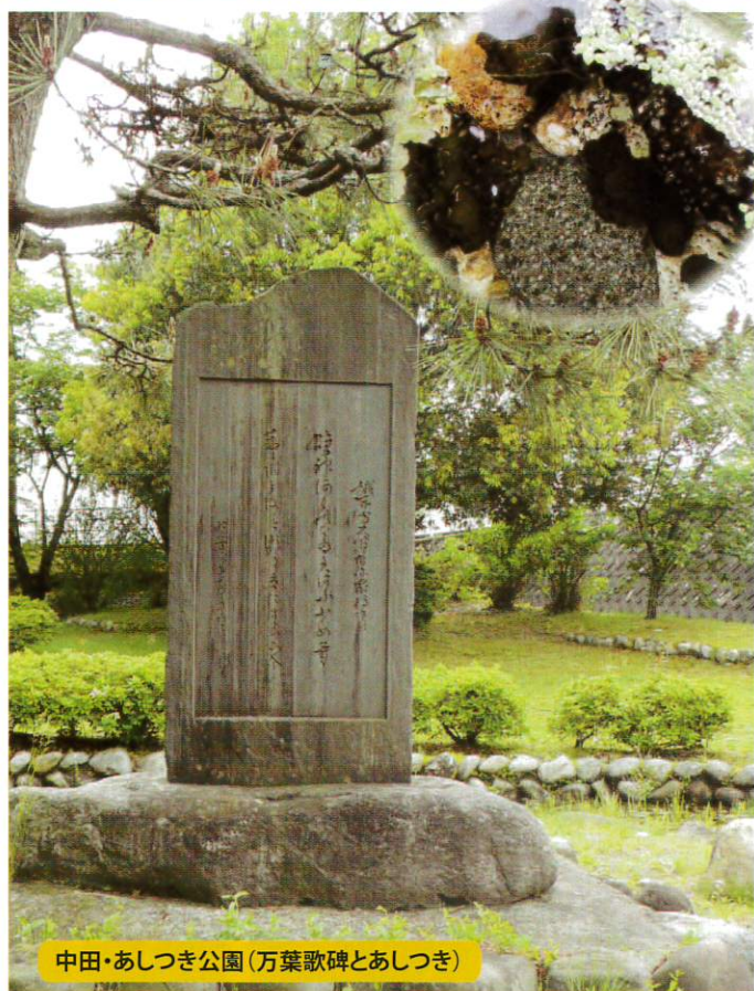
中田・あしつき公園(万葉歌碑とあしつき)