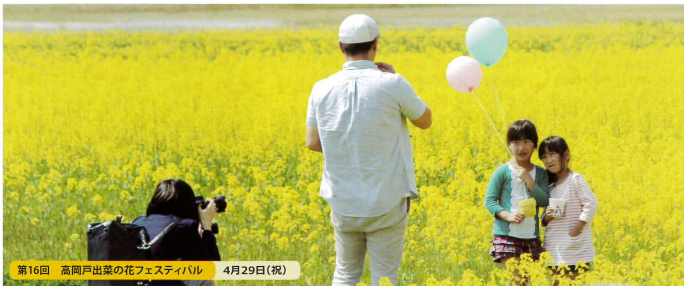
第16回 高岡戸出菜の花フェスティバル 4月29日(祝)

平成28年3月24日 発行 発行：高岡市商工会 広報委員会 〒939-1104 富山県高岡市戸出町3丁目8番10号 TEL.0766-63-6585 FAX.0766-63-6586