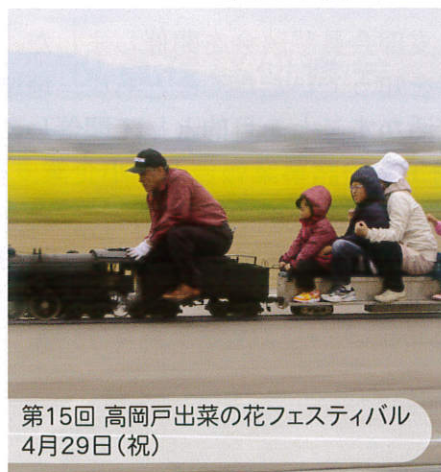
第15回 高岡戸出菜の花フェスティバル 4月29日(祝)