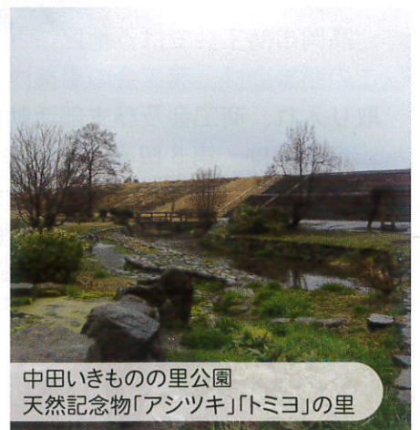
中田いきものの里公園 天然記念物「アシツキ」「トミヨ」の里