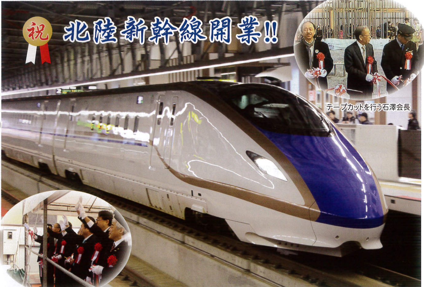
東京発新高岡駅到着の第一便 はくたか551号 3月14日 9:22