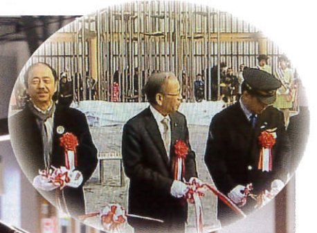
テープカットを行う石澤会長