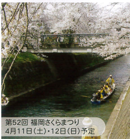
第52回 福岡さくらまつり 4月11日(土)・12日(日) 予定