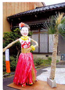
観光大使 柴田理恵 中田へやってくる