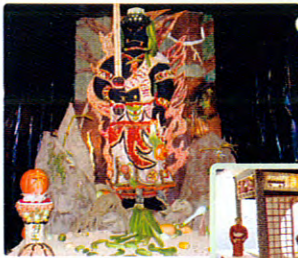
◀大型の部優勝 「末広不動尊」

当日は、よさこいIN福岡や山形花笠踊りなどの多彩な協賛事業も行われ、24日の菅笠音頭まちながし、新しく誕生したつくりもん離子の輪踊りをフィナーレに、今年もまつりは大いに盛り上がりしました。