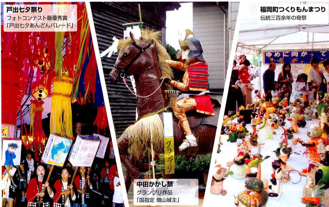
戸出七夕祭り フォトコンテスト最優秀賞 「戸出七夕あんどんパレード」

高岡市商工会が全国の商工会のモデルとなるよう、職員、役員、会員はもとより、地区住民皆様の協力も得て自らを律して努力してまいります。