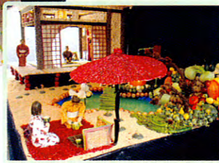
▲一般の部優勝「コイ茶」