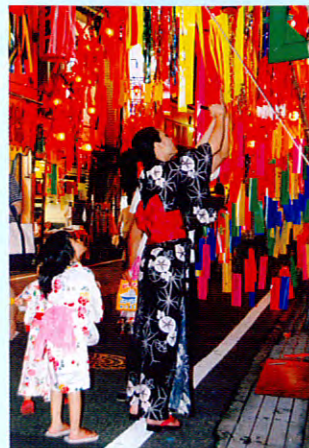
優秀賞 「心をこめて願う親子」