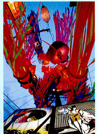
優秀賞 「かくや月に帰る」