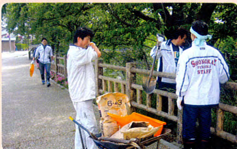
肥料やりに汗を流す隊員の皆さん

今年も5月30日に隊員11名で活動実施。「郷土の誇りの桜並木を若い世代で守っていこう」と今後も活動を継続していきます。