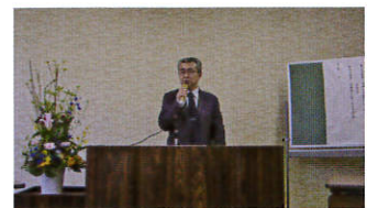
ふくおかママさんスタンプ会総会

また、6 月 19 日～20 日の 2 日間、戸出コミュニティセンター（7 月 3 日竣工）の完成を祝うイベントとして、「2 倍 + 3 倍セール」を各加盟店、商工会窓口で実施しました。