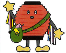
戸出七夕まつりキャラクター 「たなっちょくん」