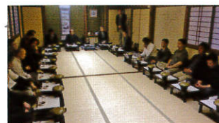
戸出町商店街連盟総会

事業計画については、戸出七夕まつり、年末大売出し、なべ祭り、高岡市商工会合併5周年記念プレミアム商品券事業の推進などが承認されました。