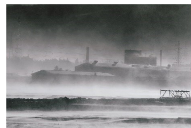
タイトル 『風の街の工場』