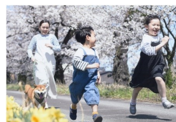
タイトル 『塩の千本桜』