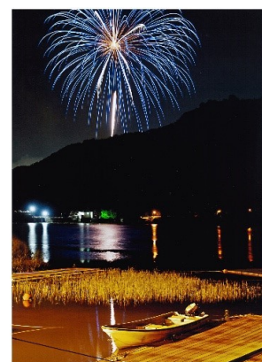
タイトル 『孤舟に大輪の花』