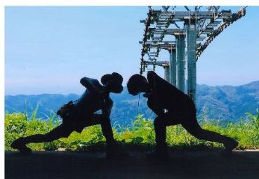
タイトル 『深呼吸』