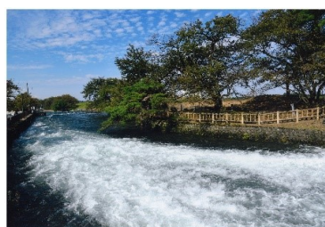
タイトル 『奔流』