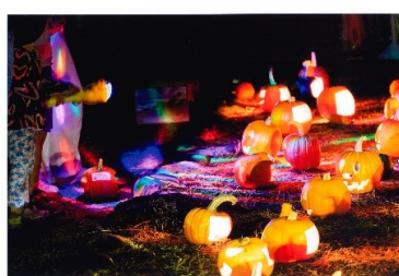
タイトル 『虹色の光の中で』