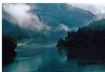
タイトル 『紅葉前のブルーモメント』