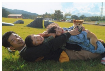
タイトル 『楽しい休日』