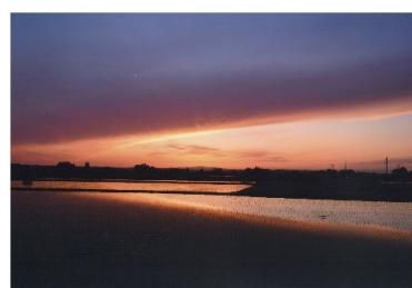
タイトル 『夕景』