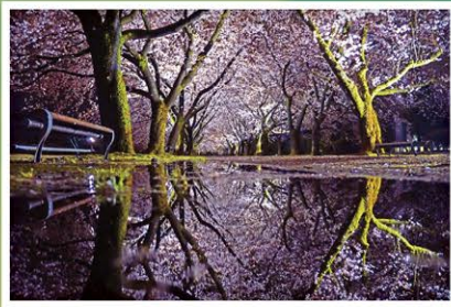
第8回 優秀賞「魅惑の桜トンネル」