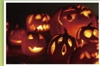
第8回 入選「ハッピー・ハロウィン」