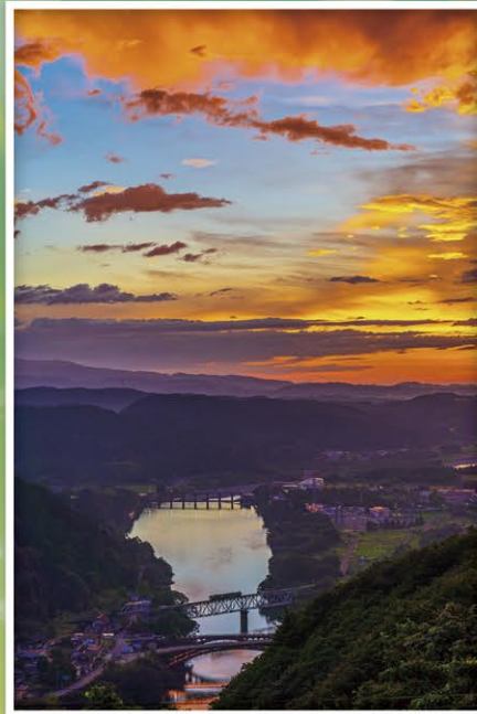
第8回 最優秀賞「染まる風の街」