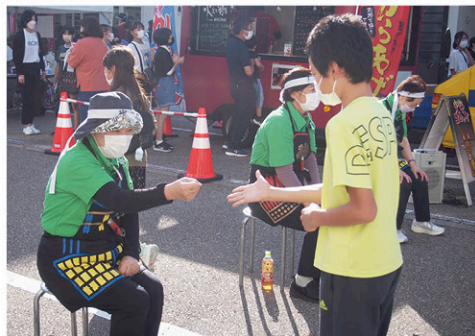
源平国盗りじゃんけん大会

から、私たちはますます団結しながら微力でも小矢部市の賑わいのために楽しみながら活動していきます。新しい仲間も募集中、いつでも大歓迎です。