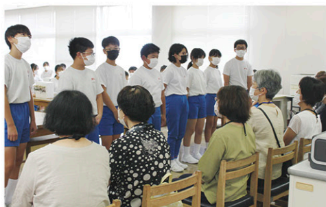
ベンチャーキッズ事業製作指導

九月十五日に津沢支部の活動である「ベンチャーキッズ事業」を視察させていただきました。この活動は津沢小学校の六年生がグループに分かれ模擬会社を設立。自分たちが考えて商品開発した手作りのバックやキーホルダーなどを十月に行われる「阿曾の市」にて販売し、商売のしくみや喜びを感じてもらうことを目的とした経済教育で三十年以上も前から続いている伝統ある行事です。商工会女性部では子供たちの要望に沿って素材等を準備し、試作品