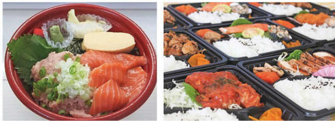
ネギト・サーモン丼 850円(税込) ALL 550円(税込)