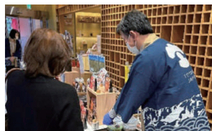
とやまの逸品フェア 2023 in 日本橋とやま館の様子