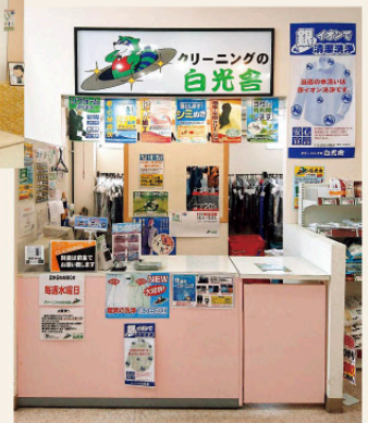
サンキュー小矢部店

弊社は、昭和32年から小矢部市津沢(本社工場)にて、クリーニング業を営んでおります。ワイシャツから着物・じゅうたん・ぬいぐるみ・布団まですべて洗える会社です。近年では、しみヌキや自社のオリジナル洗浄法「まっ白加工」を開発し、これまで落ちなかった汚れを取ることが出来、多数のお客様に喜んでいただいております。現在、高岡市、砺波市、南砺市、金沢市に「クリーニング白光舎」という店名でショッピングセンター等に店出していますので、是非一度ご利用下さい。