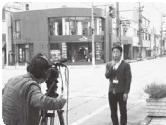
入善町商工会での就労体験