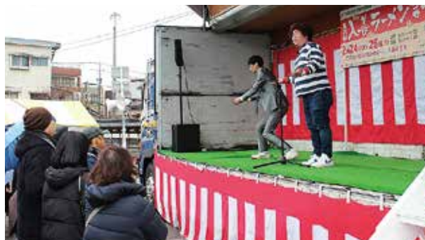
入善ラーメンまつり (令和6年2月24日・25日)