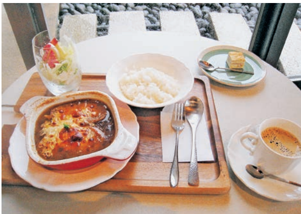
オニオングラタンスープのセット