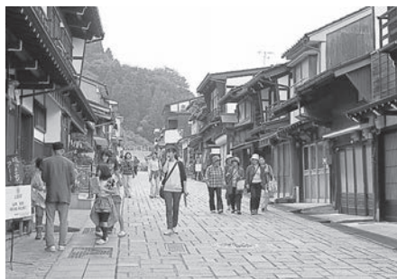
坂のまちアートinやつお会場の町並み

「坂のまちアートinやつお」は、八尾町中心部の活性化を目的に、住民や県内の作家でつくる実行委員会が中心となり、平成八年から毎年十月上旬に開催している。昨年の十月に二十回目の記念すべき年を迎え、商店や民家など、四十六箇所県内外の作家約百人の作品を展示した。作品は絵画や木彫、写真など多岐に渡る。