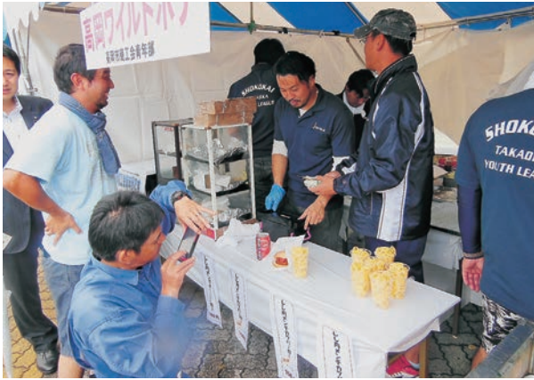
しし肉メンチカツバーガーを販売する高岡市商工会青年部の皆さん

新たな地域資源に注目し、地域を活性化させたいという青年部の情熱の炎は、今でも燃えたぎっている。