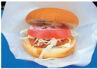
しし肉メンチカツバーガー