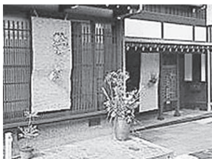
坂のまちアート野の花展示

加できないかと考え、町内に花籠と簾を配布、山野草を育てていただくということを提案。花籠には八尾和紙を貼付け、その花籠に山野草を活け、これを簾ごしに展示するという方法で、町内の参加いただける方を募集。家々の軒先を山野草で飾る「野の花展」として多くの住民が参加している。素晴らしい花を活けて見せたいという気持ちが野の花展を大いに盛り上げ、来場者への暖かいもてなしに繋がるなど、町ぐるみで楽しむ輪が広がってきている。