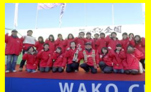
前回優勝: 石川県七尾市(鍋プロ部)