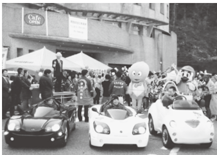
電気自動車が先導する「SPAマラソンinうなづき」

「SPA マラソン in うなづき」では、浴衣での参加を条件に様々なチェックポイントを通過することで、温泉・環境・健康づくりに関する情報を楽しく学んで頂くことや地元店舗等で利用できるエコマネー「うなづき(期間限定の商品券)」の発行を行い、「スノーシュートレッキング」では、山岳レジャーで人気のスノーシューズ(西洋かんじき)を使った無料ツアー等の