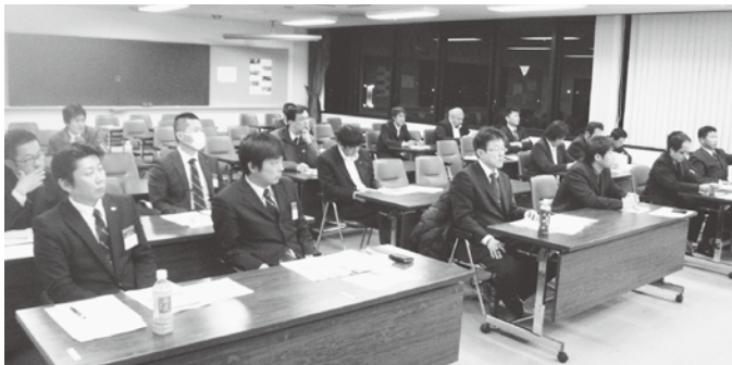
各種融資制度や資金繰り支援策等について学ぶ青年部員