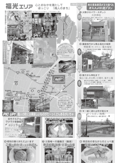
グルメやパワースポット等が満載の「南砺市周遊マップ(福光エリア)」

の青年部員が南砺市の楽しみ方教えます「」を制作した。 そのマップには、自然や歴史・文化・祭り・イベント