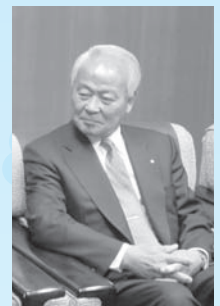
川原富山市八尾山田商工会長

串田・射水市商工会は戸倉上山田商工会と連携事業を推進しています。八月の「ふれあい商工まつりin射水」において長野フェアを実施。戸倉上山田商工会会員企業の特産品を販売しました。また、射水市において両商工会正副会長による懇談会や女性部同志の意見交換会を開催しました。十月には、先方会員企業の視察旅行にも参りました。