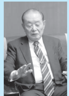
大井朝日町商工会長

大井・朝日町商工会は白馬商工会と交流を図っています。役職員同志の交流やそれぞれの地域の祭りなどに参加し、交流会議を開き、産業振興・観光振興について意見を交換しました。昨年十一月二十二日に起きた長野県北部地震は白馬村が震源地でした。二日後に正副会長で現地へお見舞金をもって伺いましたが、被害が集中した一部の地域で旅館業等を営む商工会会員さんのお店もありましたが、一日も早い復興を願うばかりです。