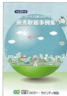
▲優秀取組事例集 (電子データのみで提供) (無料)