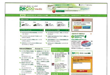
▲燃費管理支援サイトReCoo (無料/別途登録必要)