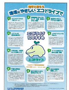
▲エコドライブ10のすすめチラシ (無料)