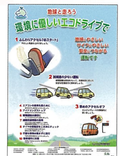
▲エコドライブ10のすすめポスター (無料)