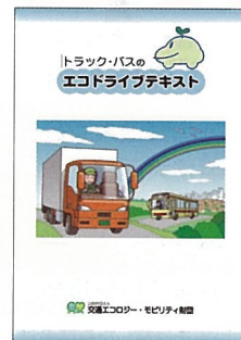
▲トラック・バスエコドライブテキスト (200円/冊)