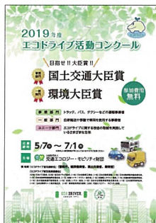
▲コンクールリーフレット (電子データのみで提供)