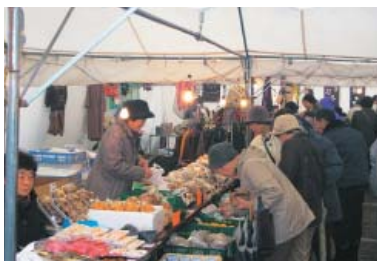
12月27日 福野歳の大市