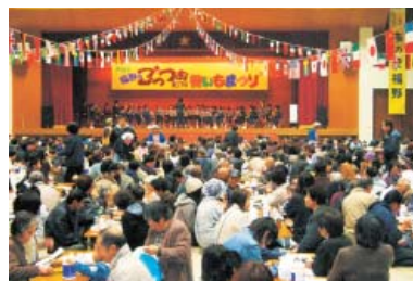
5月1日・2日 福野夜高祭