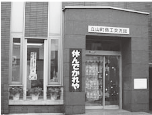
「休んでかれや」(立山町)