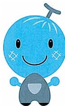
マスコットキャラクター「あみろん」

十二事業者の阿見グリーンメロンを使った力作は、七月二十八日までの一ヶ月間町内でスイーツフェアとして展示販売された。同委員会ではメロンキャラクター「あみろん」を誕生させており、特産品を積極的に売り込んでいく。阿見町は海軍航空隊のパイロットを数多く輩出した海軍飛行予科練習生いわゆる予科練の本拠地。命の尊さと平和の認識を深めるため、この貴重な歴史を保存展示するため、予科練平和祈念館を開設するなど、予科練を中心とした観光を売り出している。