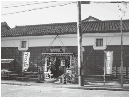
「さんちよんぴん蔵」(高岡市福岡町)

県内の地域特産品はもとより、東北や近隣県、首都圏の特産品の企画セールを行うとともに、交流とコミュニケーションの場となる催物も企画し、地方活性化に役立てていくこととしている。