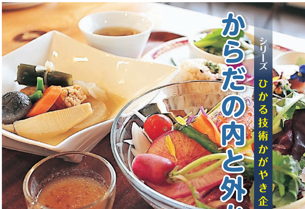
12月ランチメニュー“おでん野菜スープ仕立て”

ここで、組織体制を整え強化するため、商工会の支援を得て、就業規則等の整備を行った。 平成二十八年度には、富山市北商工会のよい店コンクルールの名誉賞を受賞し、新聞掲載されたことで反響があったと語る。