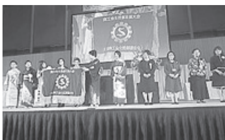
大会旗入場の様子