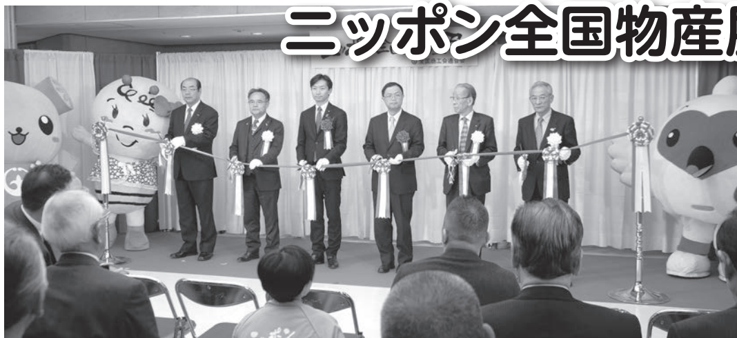
オープニングセレモニー テープカット

全国から地域の特色を生かした産品が集まる「ニッポン全国物産展2017」が十一月十七日～十九日の三日間、池袋のサンシャインシティで開催された。