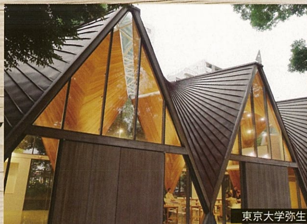
東京大学弥生講堂アネックス

戦後植林された森林が本格的な利用期を迎えており、森林資源の循環利用を推進するため、新たな木材需要の創出が求められています。こうした中、近年、木材を使った耐火部材や木造による中高層建築が可能となるCLT(直交集成板)等の開発・普及が進み、これまで木材があまり使われてこなかったオフィスビルや中大規模の公共・商業施設など非住宅分野での地域材の利用が期待されます。これからの「新たな木づかい」について、一緒に考えてみませんか！