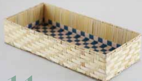
14 おしゃれボックス