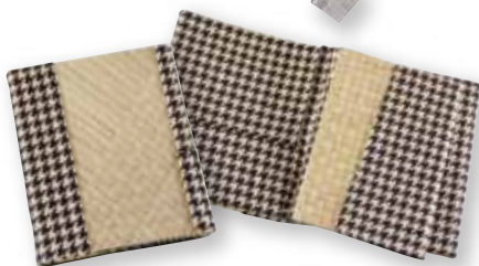
15 手帳型収納ケース