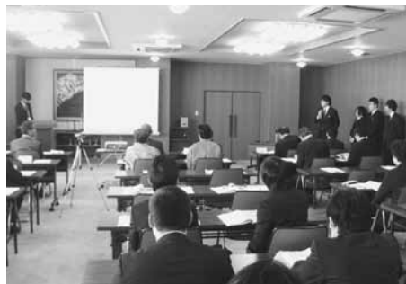
報告会で発表する学生らと参加者

県商工会連合会は十二月九日、中小企業研修センターにおいて企業や県立大学、県等の関係者を集め「研究人材能力活用事業（生産管理部長体験事業）」報告会を開催した。