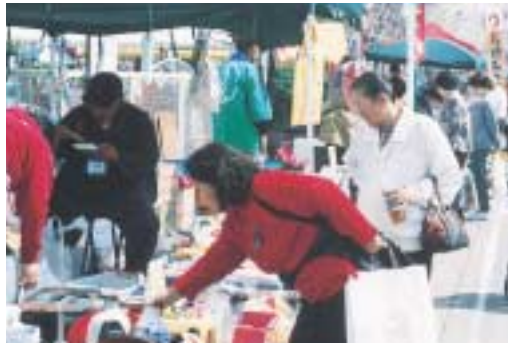
多くのテントが並ぶフリーマーケット

楽しませ、また青年部、女性部の店も人気となっています。大道芸、ミニライブ等も開催され、中心市街地活性化事業の楽しいイベントとして定着してきました。