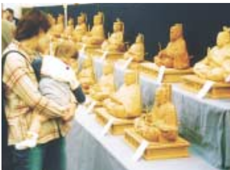
木彫り天神様の即売

十七日(日)、毎月第三日曜日に開催している恒例のつくりもん市が、福岡町カメラ館通りで賑やかに開催されます。毎回フリーマーケットの出店は、大阪、奈良、岐阜、長野、石川等県外からの出店が多く、朝取れ野菜、日用品、衣類、手作り小物、飲食、陶器、雑貨等の約五十店が並び会場を訪れるお客さんを