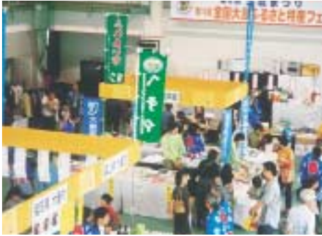
「全国大島ふるさと特産フェア」会場

九日(土)～十日(日)の二日間、大島町農村環境改善センター・セレニョーズ井波で開催される第7回大島まつりは、全国七つの大島と近隣市町村の特産品の販売を行う「全国大島ふるさと特産フェア」、へちま投げ大会、花火大会など沢山のイベントが企画されています。