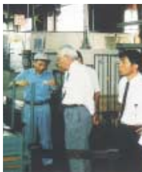
節材を活かした製品づくり

ちな古い経営体質から脱皮させるため、三年半前に現在の岡田社長が流通業から転身、社長に就任した。まず、取り組んだのは財務体質の強化や代理店制度の廃止等、利益の出る会社づくりを目指した。同時に「スピード・スリムシンプ