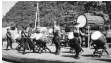
源太良太鼓の熱演(福岡町)