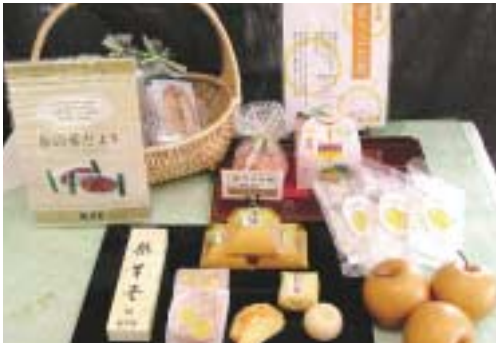
梨を具材にした商品の数々

その結果、当店に二歩入ると銘菓である、くれば梨最中」にはじまり、「梨パイ」、「梨羊か