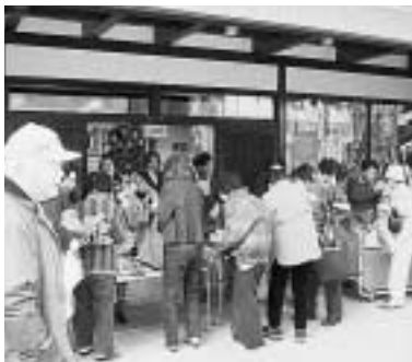
買い物で賑わうふれあい館「いっぷくや茶」

そこで、高齢者に優しい街づくり、魅力ある楽しい商店街を推進するため、空き店舗を活用し、買い物客に休憩場所を開放するとともに高齢者の方など誰もが気軽に立寄ることができると「憩いの場」「いっぷくや茶」を開設することにより、商店街の賑わいを創出しようと考えました。