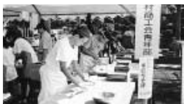
手打ちそばの実演(利賀村)

当日のアンケートでは、「砺波地区の伝統芸能にふれてよかった」「南砺市になっても続けてほしい」などの意見が聞かれた。