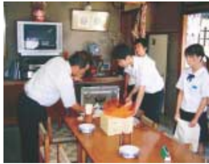
真剣に実習に取り組む生徒たち

水橋商工会薬業青年部は、八月十九日後継者の育成と地域の人々との交流の大切さを学んでもらおうと、家庭薬の一日配置実習を行った。同地区内の水橋・三成の両中学校から四十二名の生徒が参加し、八班に分かれて薬業青年部員と一緒に水橋地区の得意先約八十戸を訪れ売薬独特の「先用後利」システムを学んだ。最初は、慣れない作業に戸惑いがちの生徒たちも、徐々に