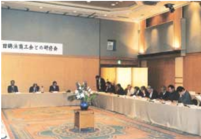
田鶴浜町商工会との懇談

700名弱で、3商工会が併存するには無理があることから、合併準備が進められている。行政の合併協議会の設立直後の平成14年9月から、合併問題の委員会、他県の合併商工会視察、首長との懇談会、アンケート調査等を