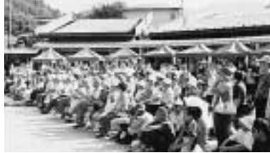
ステージ前の多くの観客