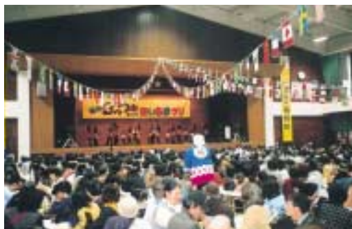
ステージを楽しみ里いも料理を味わう

「里芋」の美味しさを味わいながら収穫に感謝し、「さといもの町福野」のPRに務め、交流客の拡大を図ることを目的に開催。 婦人会、スキヤキネットワ