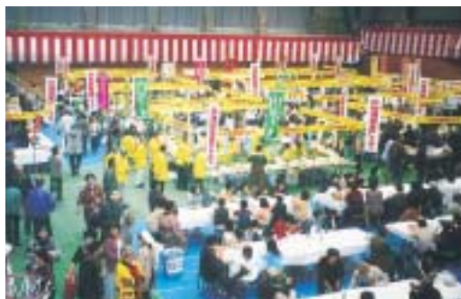
企業商品・農産物が並ぶ産業フェア

七日(日)小杉町総合体育センターにおいて第十回小杉町産業フェアを開催致します。今回は、新嘗祭に献上した粟、鰻絵を紹介するコーナーを目玉として、来場者に町の産業(新鮮な農産物や企業商品・製品)にふれて、見て食べて遊んでをキーワードに町・商工会・農協が一体となり実施