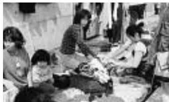
フリーマーケット

45万円の特別控除 簡易帳簿によるが、確定申告時に資産負債等を明らかにし貸借対照表等を添付した場合、期限内申告が要件となり、小規模不動産所得は適用なし。平成17年より廃止される。10万円の特別控除 前記以外の青色申告者 (税理士 菅原昌仁)