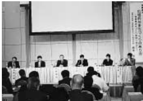
商店街活性化策を意見交換するパネラー

まず、現状の問題点として各パネラーから、商店数が右肩下がり減少が続く、昭和五十三年統計に比較して三千