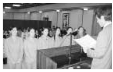
修了証を受ける研修生

山本専務理事が「技能実習生として引き続き二年間高度な技能の習得に励まれ、日中友好の絆をさらに強める架け橋となつてほしい」とはなむ