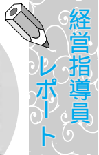
経営指導員 レポート