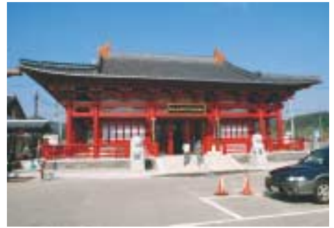
中国伝統建築の「紹興友好物産館」

福光町商工会が委託管理する道の駅福光に、中国の友好市町締結二十周年を記念し「紹興友好物産館」が建築されオープンした。今年二月に中国で木材加工され、七月に日本へ運び中国人技術者十六人が来日して組み立てた。建物は、中国伝統建築の木造瓦葺約六十八坪で高さは