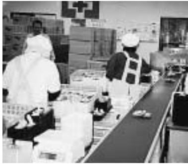
シイタケパック作業

出荷を始めたシイタケは形がよく肉厚で消費者受けが良いなど、市場評価が高く、細入ブランドとして中京圏で人気になるなど順調に推移している。ただし、補助を受けた経緯から生鮮品としての県内