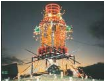
冬の夜を飾るイルミネーション

参拝は元日午前零時、花火を合図に始まる。厄払いや家内安全、商売繁盛など特別祈願も同時に受け付ける。 これから年末にかけ、氏子らによる境内の清掃や駐車場整備を行い参拝客の受け入れ態勢を整える。