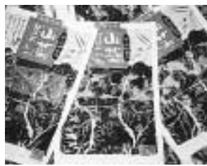
開発した「昆布じめしいたけ」の確立を目指して頑張っている。

販売に制約があつて、このため、県内流通を行うためには二次加工が必要となり、その商品開発を商工会女性部の特産品加工グループ「ふきのとう」が担っている。