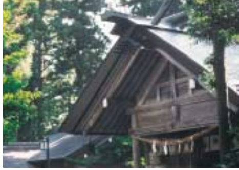
大勢の参拝客が予想される櫛田神社

延喜式櫛田神社は来年の初詣の準備を急ピッチで進めている。 参拝客を十三万〜四万人と見込む。スサノオノミコト、素戔嗚尊」とクシナダヒメノミコト「櫛田稲田姫命」の神話にちなんだ同神社特製の「幸せの櫛」をはじめ、破魔矢、熊手など数々の縁起物を既に取り揃えた。