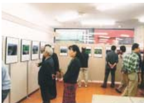
オープン初日から開催の写真展