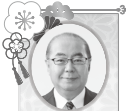
富山県知事 新田 八朗

県では、激甚化・多発化する自然災害や人口減少、デジタル化・DXの加速など、社会経済情勢が大きく変化するなか、様々な新たな課題に対応するため、昨年十二月に、『富山県総合計画』『幸せ人口一〇〇万』『ウェルビーイング先進地域』を策定しました。この計画では、本県の活力を支え発展の礎となる「未来に向けた人づくり」、県民が躍動する舞台を創出する「新しい社会経済システムの構築」の二つを柱としています。