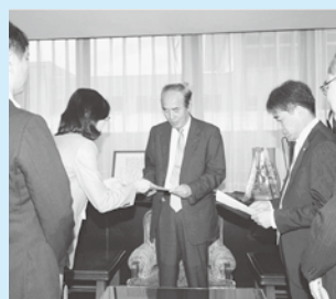
「新規学校卒業生」に対する求人確保を要請