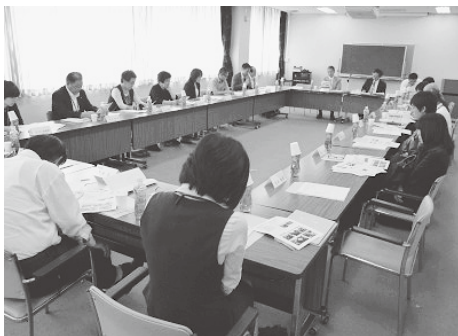
議論を交わす委員メンバー