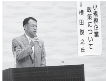
横田中小企業庁次長

九月二十七日に「平成二十五年度商工会役員等研修会」が中小企業研修センターにおいて約百名が参加し開催された。