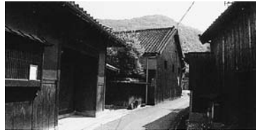
まいの郷の醬の磨かれたる時を

香川県の小豆島は、オリブ栽培発祥の地として有名だが、昔ながらの醤油蔵が軒を連ねる小豆島町馬木、苗羽地区の「醬の郷」も良く知られ、観光客が散策を楽しんでいる。