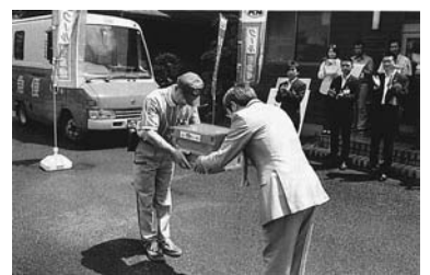
出発式で、専用宅配ボックスを受け渡した

町内在住の六十五歳以上の人を対象に、注文金額二千元以上で日本郵便かヤマト運輸が配達する。利用者は電話で加盟店に注文。加盟店から宅配業者に配達依頼があり、利用者は配達業者に商品代金と宅配手数料を支払う仕組み。配達手数料は二百円と格安で、町と商工会が一部を負担することで実現した。