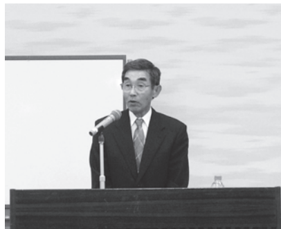
大利美郷町商工会長

六月十四日に閣議決定された「ちいさな企業」成長本部中小企業・小規模事業者の成長に向けた四つの具体的な行動計画