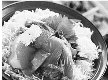
各店が趣向を凝らしたひしお

ると、一部の蔵では土日祝日も対応してくれるようになった。さらに、商工会では全国展開支援事業の補助を得て、ホームページの作成や商品開発などを行つてきた。