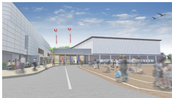
テクノホール増築外観イメージ

順調なスタートとなりました。今後とも、物販、飲食、観光・定住・UIJターン、交流・イベントなどの多彩な機能を活かし、市町村等と連携しながら本県の魅力発信に努め、誘客や移住、県産品の販路開拓を促進してまいります。 また、テクノホール新展示場については、本年十月の開館に向けて、着実に整備を進めているところです。ビジネスユースに重点をおき、催事の大規模化・複合化に対応できる多機能型展示場として、展示面積を現在の約三、四〇〇㎡と合わせて二倍以上の約八、〇〇〇㎡に拡充します。