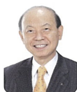
名誉塾長 石井 隆一 富山県知事

元気な高齢者がもっと活躍できる「エイジレス社会(生涯現役社会)」の実現のため、地域活動やボランティアを通じて地域社会の担い手を目指す方に対する実践的な講座と交流の場です。