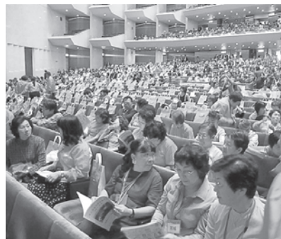
多数の女性部員が参加

時間が設けられ、各商工会地域の特徴や女性部の個性あふれる映像も見どころとなった。