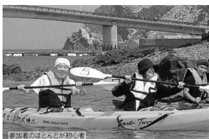
参加者のほとんどが初心者

地域に若手事業者は増える気配は少ないが、観光事業を通じて地域とのつながりも深まり、今後も協力して、地域を守りたいと青年部長は話す。