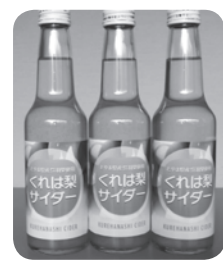
くれは梨サイダー

富山市北商工会女性部呉羽支部では、地域の特産品である「呉羽梨」を使ったサイダーを試作した。