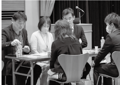
バイヤーとの商談風景（会場）