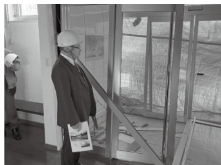
被災地を視察される森会長