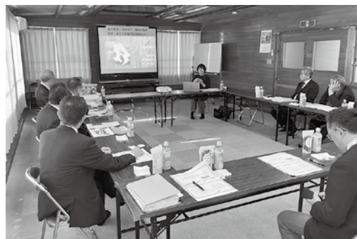
始良市商工会にて

「地産地販」をテーマとして、鹿児島県内の小規模事業者が開発した特産品の販路開拓を支援する鹿児島県連直営のアンテナショップとなっている。