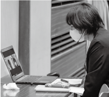
バイヤーとの商談風景（オンライン）