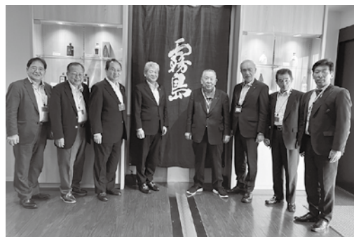
参加者による集合写真

業者もあれば、開発した商品を直接事業者が販売し消費者の声を聞くテストマーケティングの場として活用する事業者もいる。