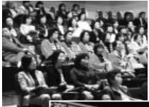
先進的、独創的な事例を学ぶ

発表者はそれぞれ、パワーポイントを用いてプレゼン形式で事業の経過や成果について視覚にうつたえる発表を行い、成果物等を用いながらわかりやすく説明を行った。