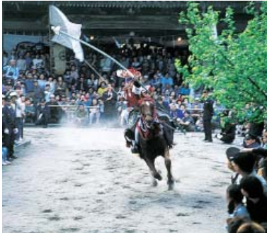
疾走しながら大弓で的に矢を放つ

四日(金)、下村加茂神社春の大祭のみどころは、騎手が大弓(三・六メートル)を持ち、疾走しながら矢を放つ「流鏑馬(やぶさめ)式」。矢を射る壮大なアクションに歓声が沸きあがり、多くの見物客が興奮に酔いしれる。