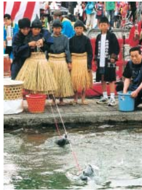
鵜飼を体験する子供たち

第十回売比河鵜飼祭が、二十七日(日)に婦中町の富山イノベーションパーク横を流れる田島川にて開催される。