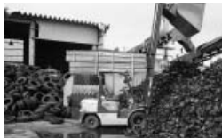
◀更生タイヤ製造施設

ず、また、付加価値向上が当社の経営課題でもあるため、取組むべき事業であると認識をした。こうした新規事業への取り組みを他社に先駆けて実施することは、先行優位性があり当社としても、積極的に推進していくものです。 顧客からは、建設・産業車両用更生タイヤメーカーが県内に必要であるとの要望も多数ある。県内において、更生タイヤ製造工程を設置することで、 ◆今後の抱負 今回、経営革新の認定を受けたことで、当社が計画している実施計画を着実に進めていく。また、製品の品質にも注意を払いながら顧客の要望にも気配りをしながら満足度を高めていき、当社のコアビジネスとしたい。