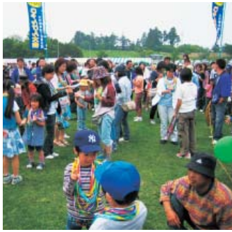
ジャンボじゃんけん大会

メイン会場の芝生広場では、商工会青年部が行う恒例の勝ち抜き戦「ジャンボじゃんけん大会」や子供に人気のキャ