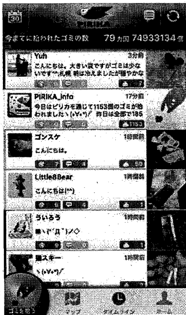
スマホアプリ用画面