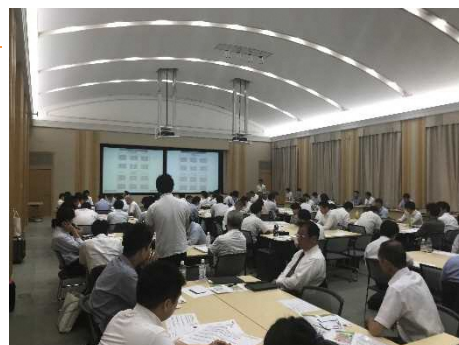
H30年度上半期 関東ブロックにおける研修会場