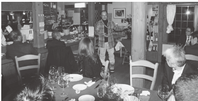
イタリア料理店「エルバッチャ」で開催された食談議

一方、食談議事業では、二月四日から二十日にかけて、地産地消や新メニュー開発、料理人や農家等からの食に対する熱い想いのトークなどを基本スタンスとして八尾町内の八飲食店にて開催した。これから事業に参加された方の多くは次回開催を希望しており、今後につながる一定の成果があった。このおもてなし事業は今年度に最終年を迎えるが、今後、エコツアー事業では、そういった地域を巻き込んでのツアーを実施して頂く事業者が出てくることや食談議事業では、新たなメニューやサービスの開発とそのテストマーケティング、販売促進活動として、個々の飲食店が独自に継続開催を頂くことが必要と考えている。