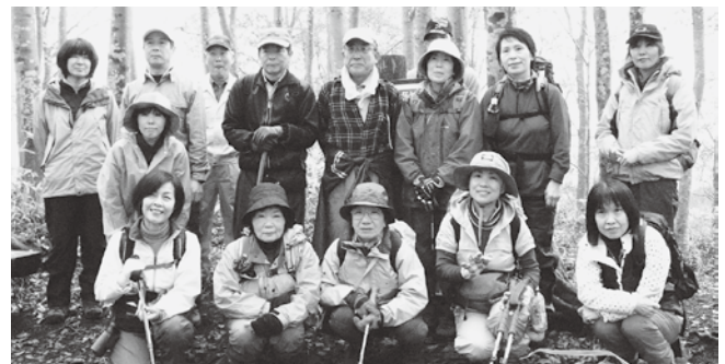
紅葉の牛岳で「ブナ林」を散策