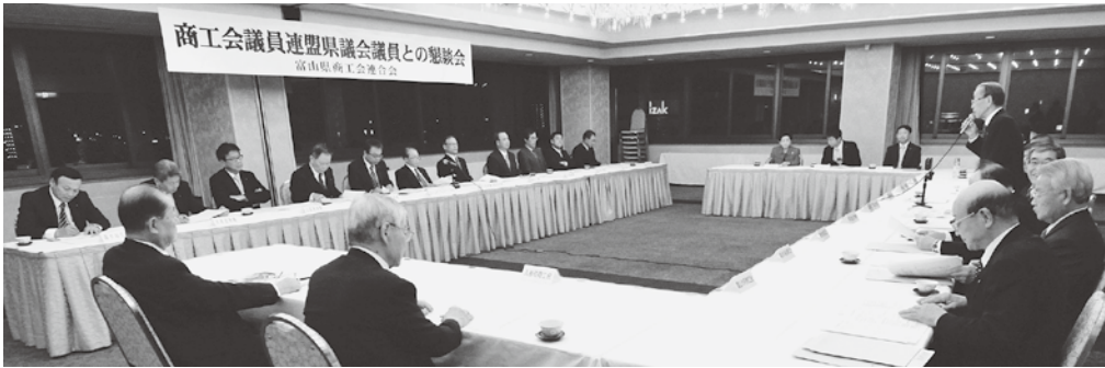
昨年 12 月 4 日、「県商工会議員連盟との懇談会」で商工会関係予算を要望

県の平成二十五年度の一般会計予算案が二月二十五日に発表され、北陸新幹線を活かした地域活性化策など、県の未来を切り開く積極型予算となっている。(関連記事一〜三面に記載) 商工会関係の県補助金等(小規模事業指導費補助金等)は、県議会議員の支援もあり、総額で約八億五千万円と要望額通り。