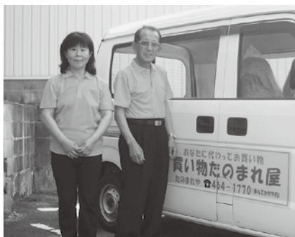
買い物たのまれ屋スタッフ