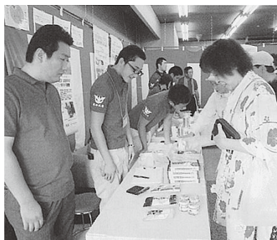
地元の方々との販売交流会