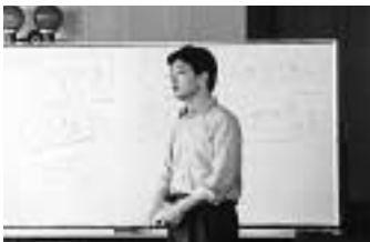
情報が人を動かす

また、経済の活性化とは、お金が動くことであり、お金を動かすには人を動かし、情報が人の動きを大きく左右する。ネット上の情報をどれだけ見やすく編集して見せるかが大切であると強調された。