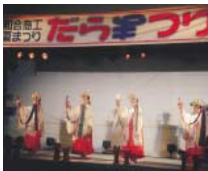
巫女による「浦安の舞」

和合商工夏祭り「Waigoo! だらまつり」が八月七日(土)、四方海浜公園特設ステージ帯で開く。