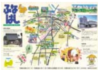
村全体が一目でわかるマップ

新しく村民になつた方達や来村者に村をよく知ってもらおうと、これまでにない、わかりやすく、見やすいマップを作成したものである。村広報と一緒、に全所帯に配布するとともに、村の公共施設等に配布する予定。