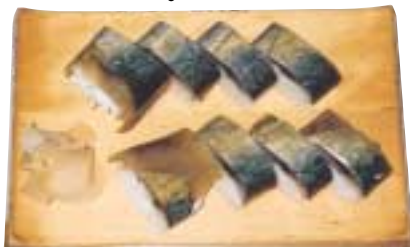
活のいいサバを素材に