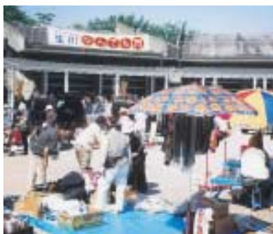
オリジナル商品も多数販売

「この夏、猛暑とともに、景気は『不況を脱出』したよつである。今年の春の『企業決算』は最高益を記録した企業が多い。また、二〇〇三年度の『設備投資』が九九年にハプル経済が崩壊した以降、最も活発な額と伸び率である。」