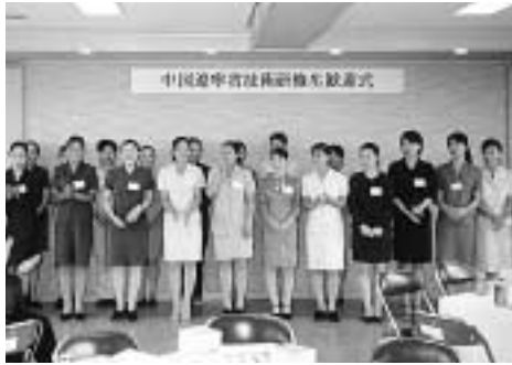
多くの研修生を受け入れての歓迎式

数年前より受入れを行なっている会社の研修生が三年の研修期間を終えて全員帰国することになり、この事業もこれが最後になるのかと思われたが、今年三月に他社より、この事業について相談したいと連絡があり、早速に実訪を行ない説明をした。会社は受入れしたい希望をもっているにもかかわらず、どうも決断がつかない様子であり、さらに話を聞くと、今は仕事が大変忙しいが、来年以降の