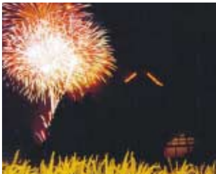
夜空を彩る送り火「八文字焼」

メインの「火祭り新事」では、夕刻に海岸に敷き詰められた約三百本のたいまつに点火し、それを合図に華麗なるファイアーショーなどが繰り広げられ、終演近くに巫女がたいまつ