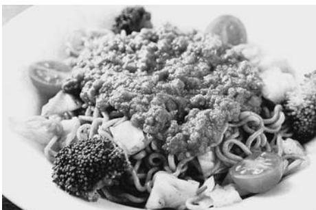
昭和40年代に県内で愛された「ミート焼そば」がベース