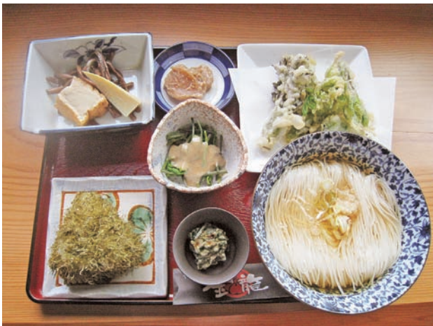
つるぎの恵み・春定食

今回、参加店の一つで山菜料理の本場である大岩で三十年以上営業されている「そうめん金龍」さんを訪問した。ごごみ、ぜんまい、こしあぶらなど、山菜が盛りだくさんの「つるぎの恵み・春定食」を自慢のそうめんと一緒に、おいしい山菜料理を味わえるこの季節に、上市町に一度ならず三度、足を運んでみてはいかがだろうか。