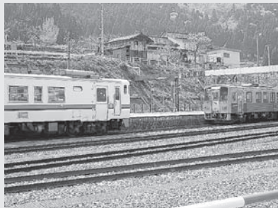
右 JR 西日本 (富山側) 左 JR 東海 (岐阜側)

上越妙高駅二、三〇〇人、糸魚川駅六〇〇人、黒部宇奈月温泉駅七〇〇人、富山駅四、七〇〇人、新高岡駅一、六〇〇