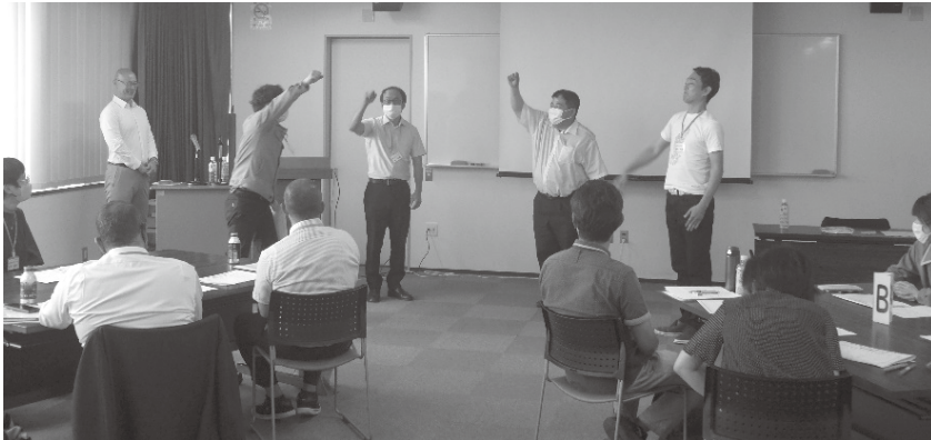
「やる気を引き出すリーダーシップ」の様子

今年度のとやま中小企業人材育成カレッジ短期コースは「やる気を引き出すリーダーシップ」を皮切りに「若手社員働き方改革セミナー」「女性リーダーのためのステップアップセミナー」等順次開催され、受講生は自らの組織の活性化や課題解決を図るべく、熱心に次世代のリーダーを目指し取り組んでいます。講師陣と受講生のコミュニケーションも高まりフレンドリーな楽しい講座となっております。