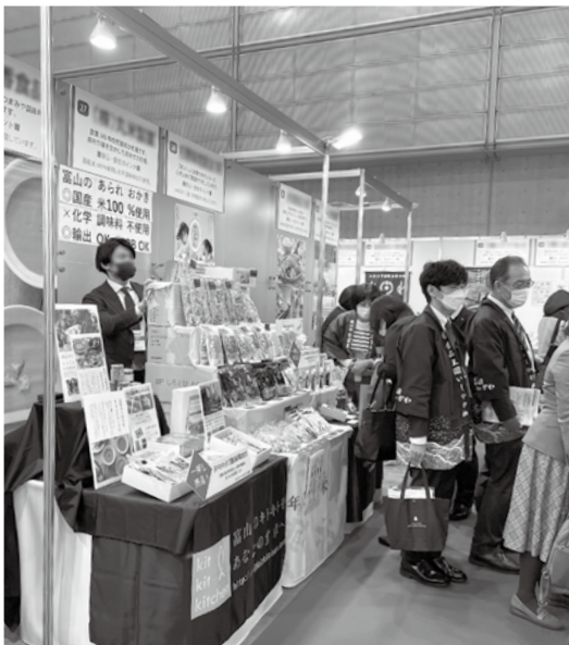
昨年の商談展示会の様子

全国スーパーマーケット協会が主催するスーパーマーケットを中心とした食品流通業界に最新情報を発信する商談展示会です。全国の小売業をはじめ、卸・商社、中食、外食などから多数のバイヤーが来場します。新たな販路開拓にぜひご活用ください。