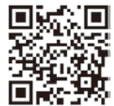
▲WEB申込はこちらから

【実施主体】富山県 担当：商工労働部多様な人材活躍推進室人材確保推進課 電話：076-444-8897 【事務局（株式会社Matchbox Technologies）】※富山県より運営を委託しています。 担当：マッチボックスサポートセンター 電話：050-1780-3754（※） メール：matchbox-cs@matchbox.jp （※）年末年始以外土日祝もご連絡可能です。事業者様専用連絡先ですので求職者への案内はご遠慮ください。