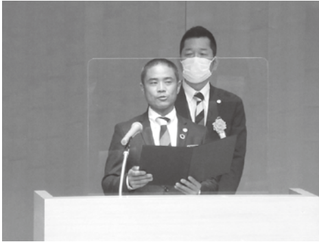
行動宣言を述べる中井県青連会長