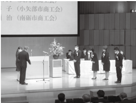
個人表彰を受賞された職員の皆様