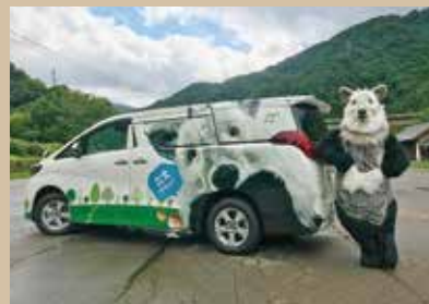
(小規模事業者持続化補助金活用事例)