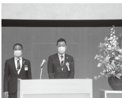
越智商工会未来創造本部長

引き続き団体表彰として、農商工連携推進において顕著な支援を実施された商工会、小規模事業者持続化補助金を積極的に活用し、小規模事業者の販路拡大等の経営支援に努められた商工会、また、個人表彰として優秀な経営支援事例を提案した職員を表彰した。