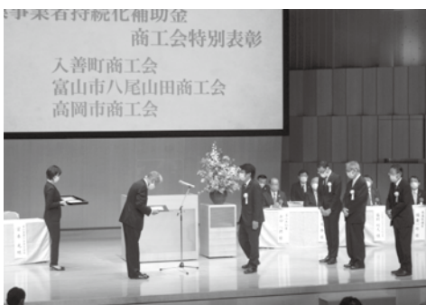
団体表彰を受ける4商工会長 (富山市北・入善町・富山市八尾山田・高岡市商工会)