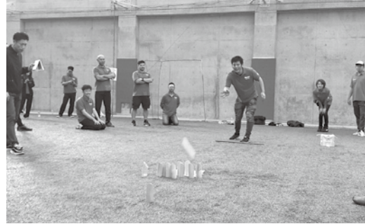
優勝を決めたブラックジャンボールチーム

商工会青年部レクリエーション事業が、10月5日(木)に富山県総合運動公園屋内グラウンドにおいて開催された。県内の各商工会青年部より19チーム総勢80名が参加し、フィナンダ発祥のスポーツ「モルック」を通じて、交流・親睦を深めた。