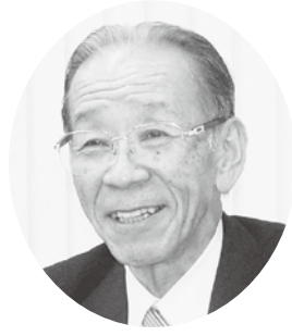
全国商工会連合会会長 石澤義文氏

商工会の全国組織である全国商工会連合会の第五十一回通常総会が五月三十一日に東京港区にある第一ホテル東京において開催され、任期満了に伴う役員改選において富山県連合会長の石澤義文氏が全国商工会連合会会長として再選された。