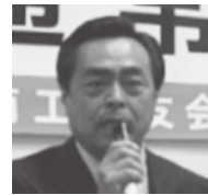
退任の挨拶をされる道古会長