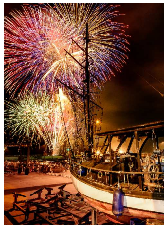
▲ 黒崎 宇伸 様 （作品名：いざ、出航）