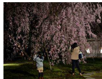
中井 盛三 様