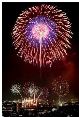
▲ 梶谷 隆 様 （作品名：平和の花束）