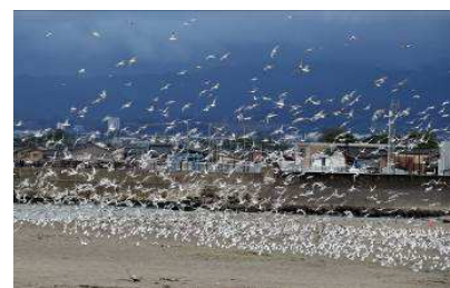
▲ 内山 康弘 様 （作品名：群翔）