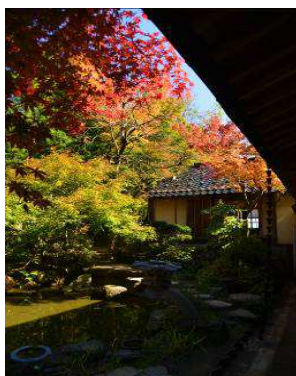
松永 正昭 様