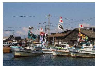
若林 繁 様